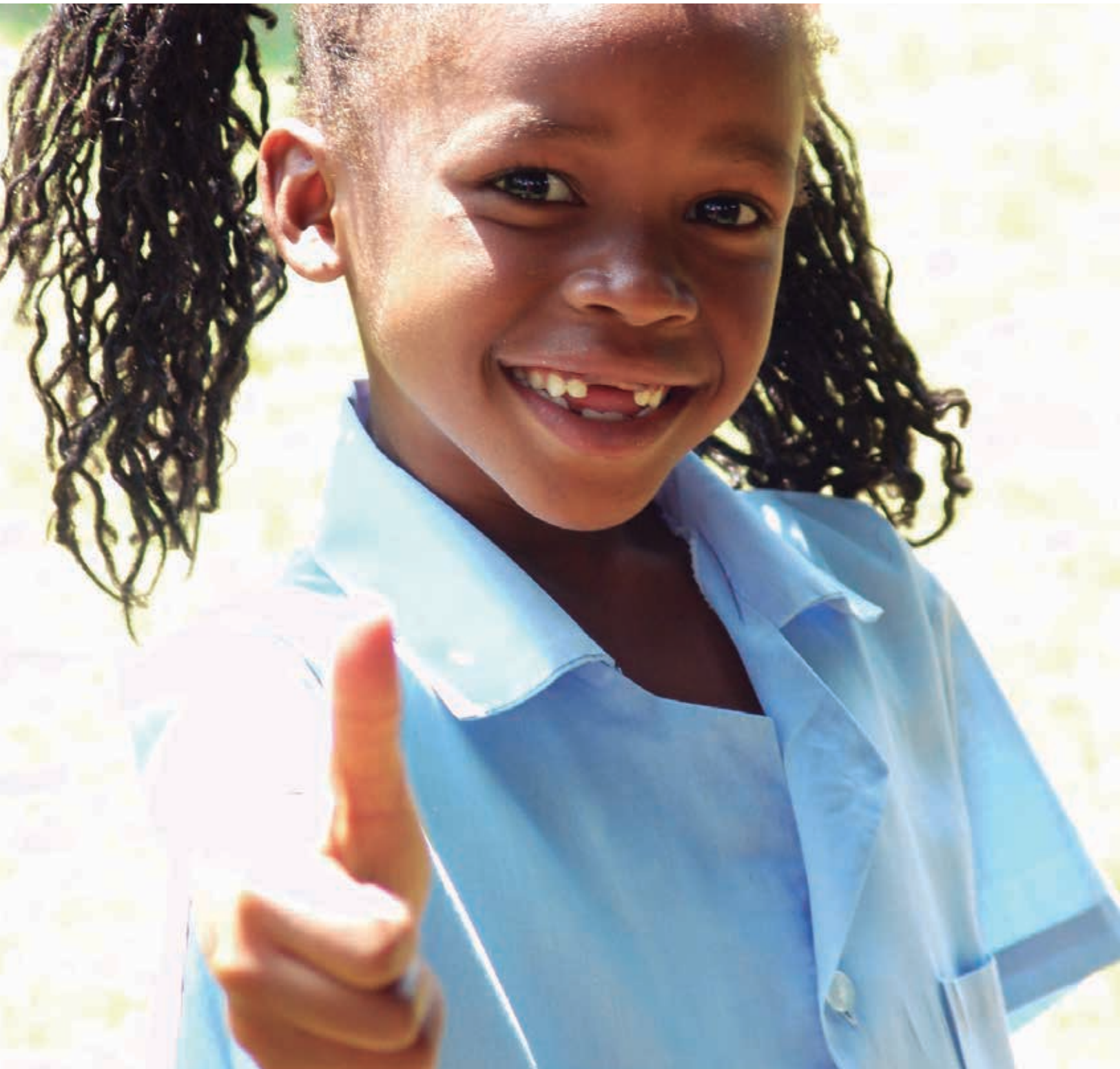
Foto 22. Niños de la Fundación Hormiguero