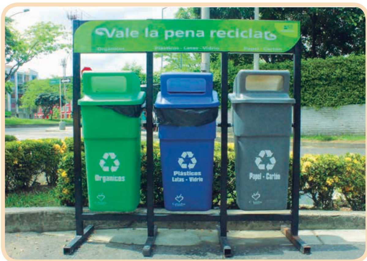
Foto 32. Estación de reciclaje