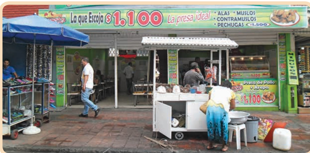
Foto 19. Comercio de comidas, Cali