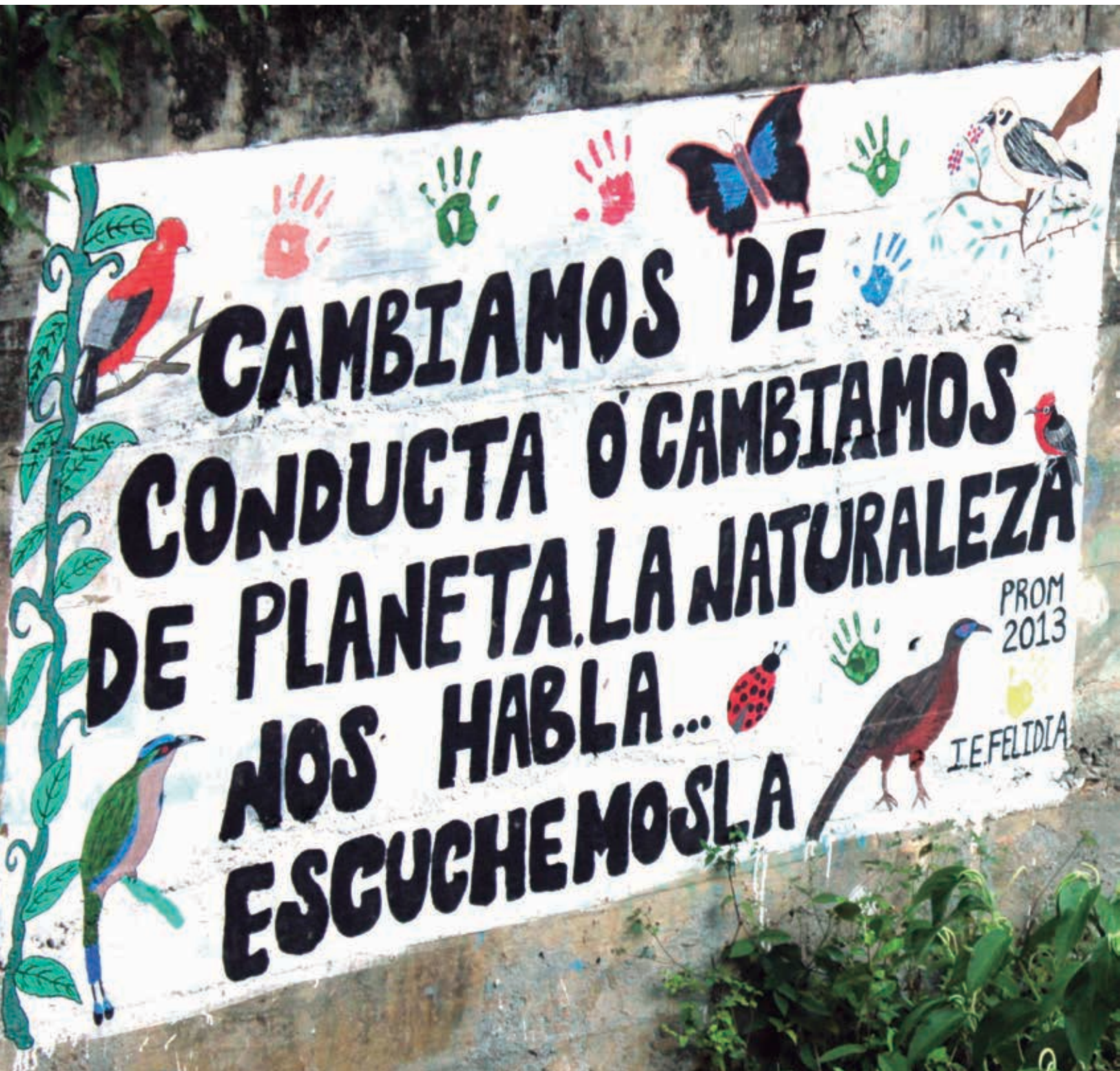
Foto 38. Promoción educación ambiental, río Felidia