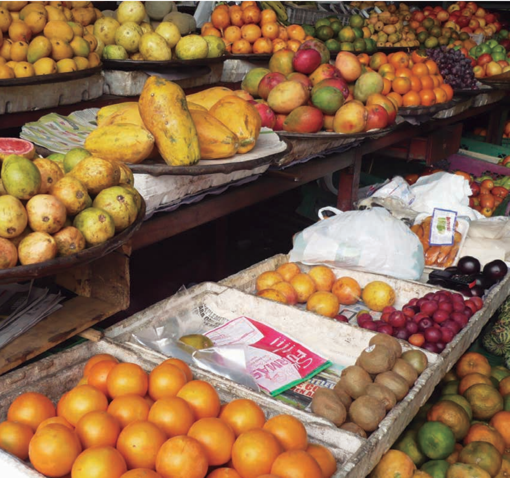
Foto 12. Mercado de frutas, galería de Cali