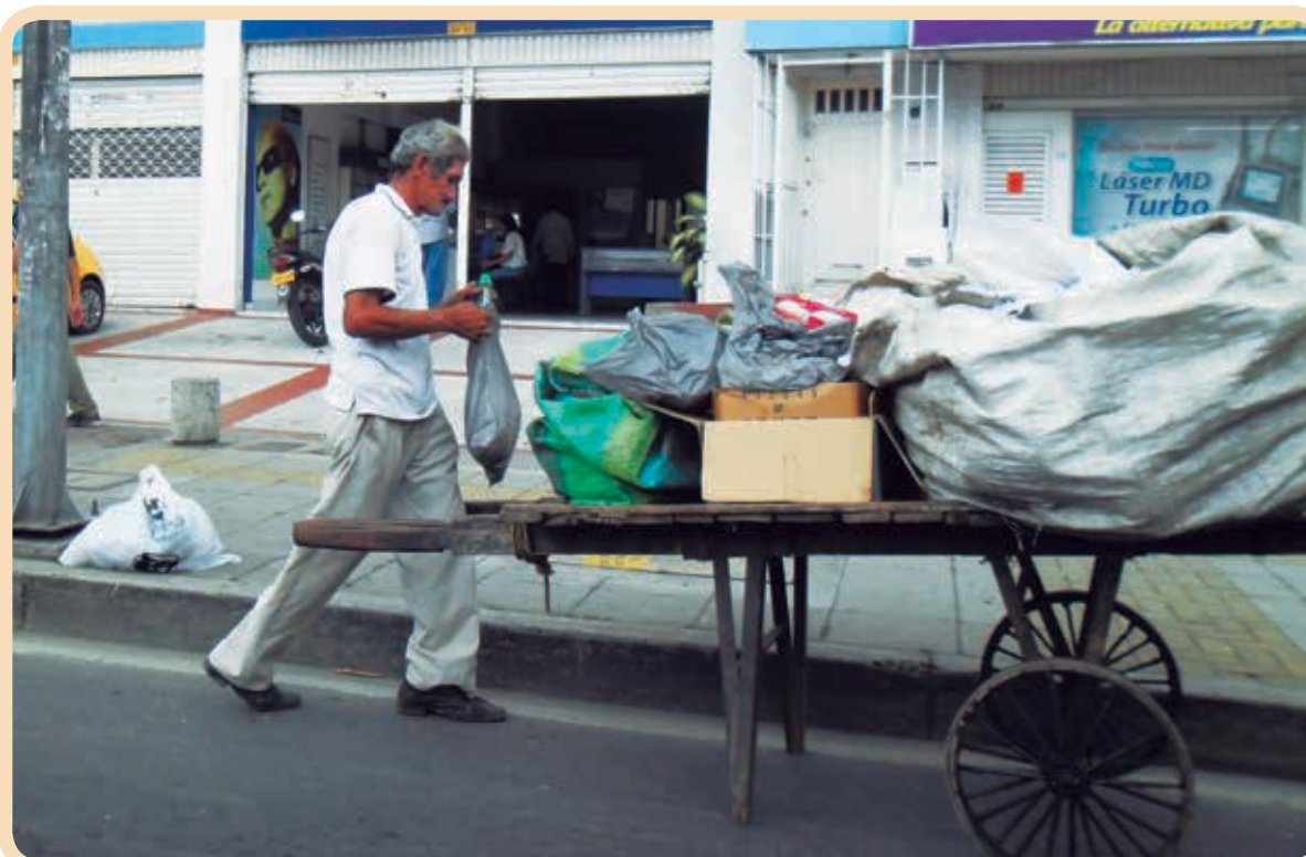
Foto 11. Labor de reciclaje, Cali

Las proyecciones indican que en Colombia en el año 2014 se podrían generar cerca de 150.000 toneladas de residuos de computadores y periféricos, si no se avanza en su recolección y gestión ambiental adecuada. El programa de recolección selectiva que realiza la ANDI a través de Ecocómputo recogió en el año 2013 1.070 toneladas de residuos electrónicos (El País, 2014, p. E3). El año pasado en el mundo se produjeron 49 millones de toneladas métricas de basura electrónica, equivalentes a 7 kilogramos por cada habitante del planeta (El País, ídem.).