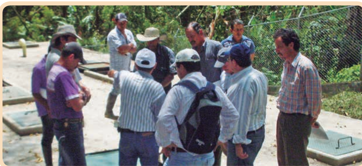
Foto 16. Reunión de trabajo CVC y la comunidad

po; dentro de la Corporación existen profesionales que tienen conocimiento sobre varios temas relacionados con hábitos de consumo sostenible, solicite su acompañamiento o asesoría, no gaste tiempo valioso en hacer de nuevo cosas que sus compañeros ya han hecho, como diapositivas, guías entre otros.