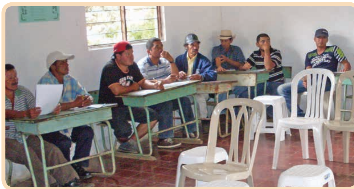
Foto 14. Jornada de trabajo CVC con campesinos de la región