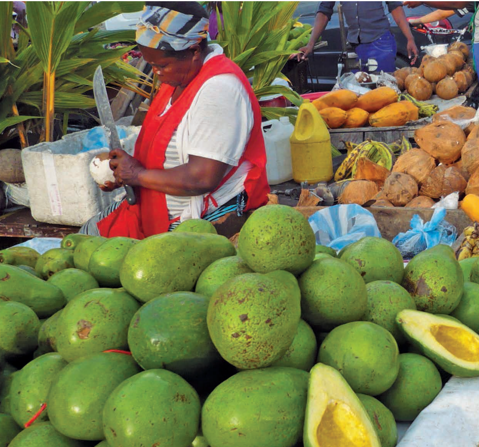
Foto 8. Mercado de frutas, galería de Cali