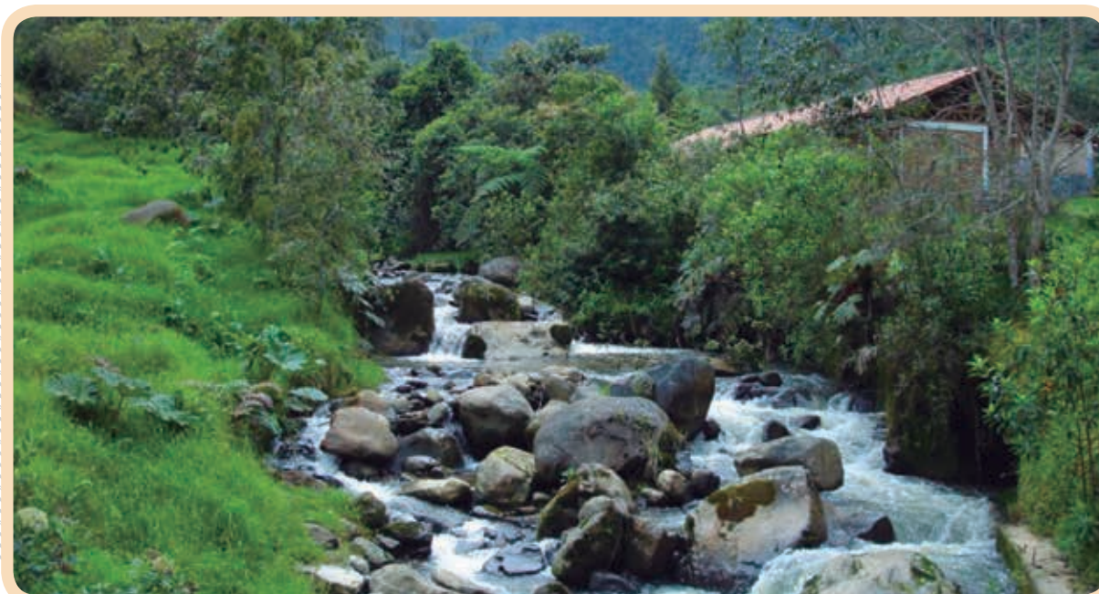
Foto 28. Vertiente andina, municipio de Tuluá