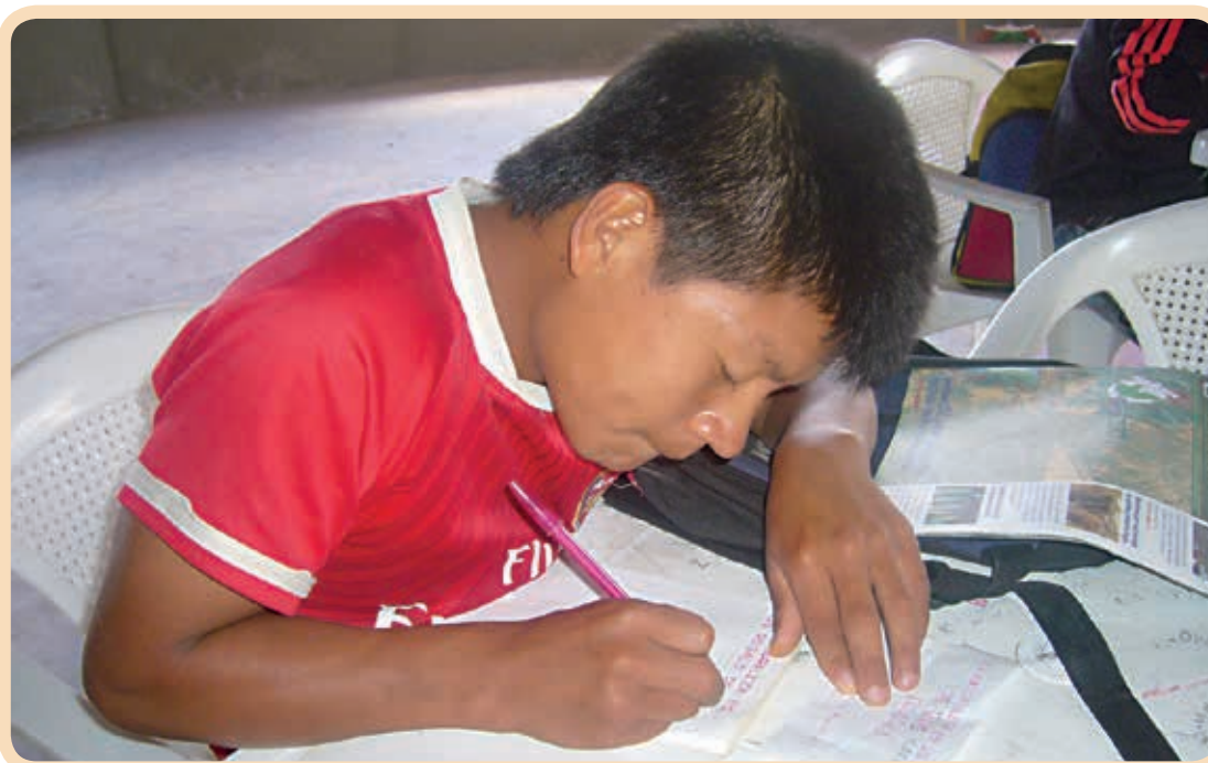
Foto 7. Estudiante zona rural, Valle del Cauca