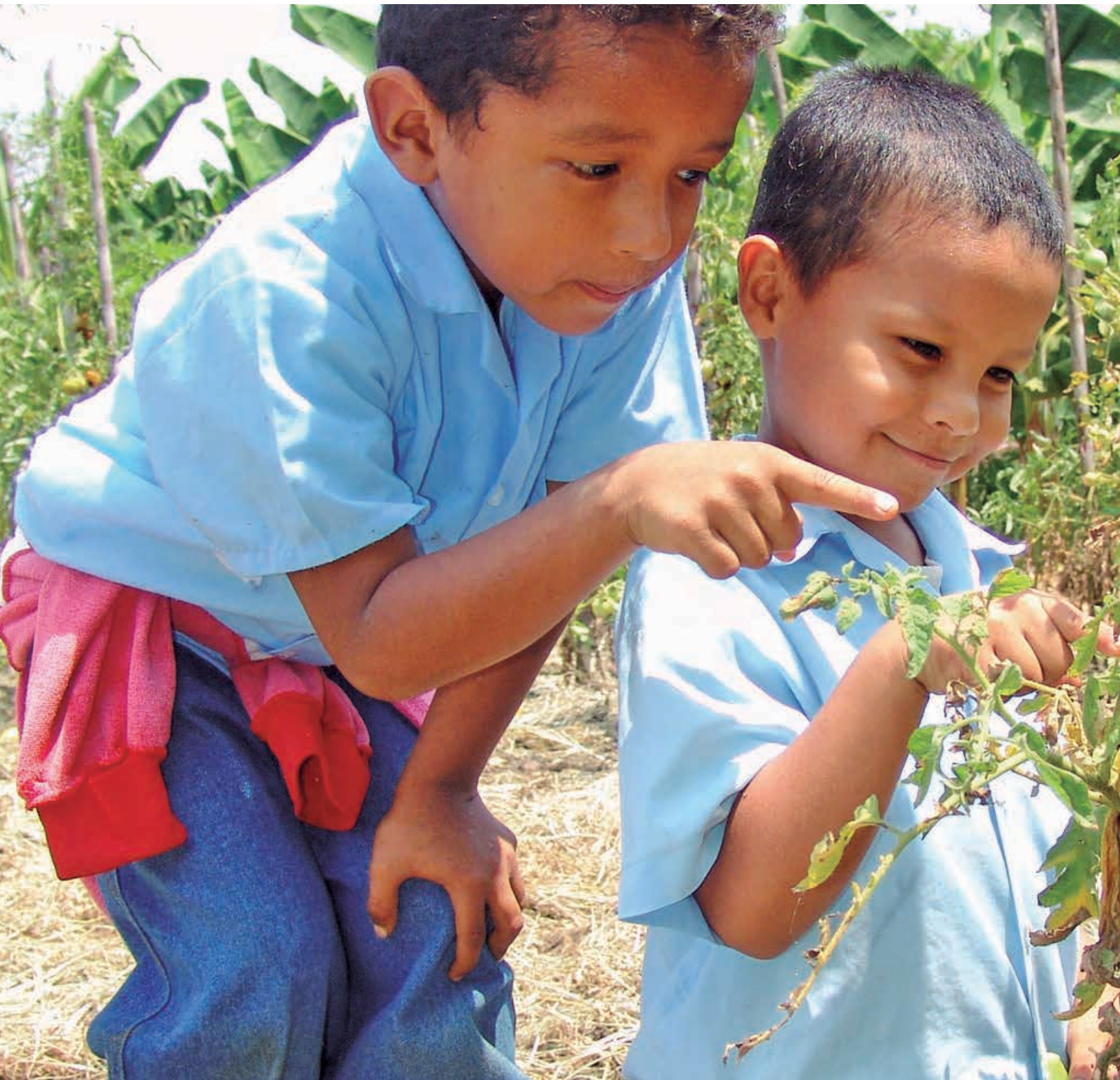
Foto 18. Huerta de los niños Fundación Hormiguero