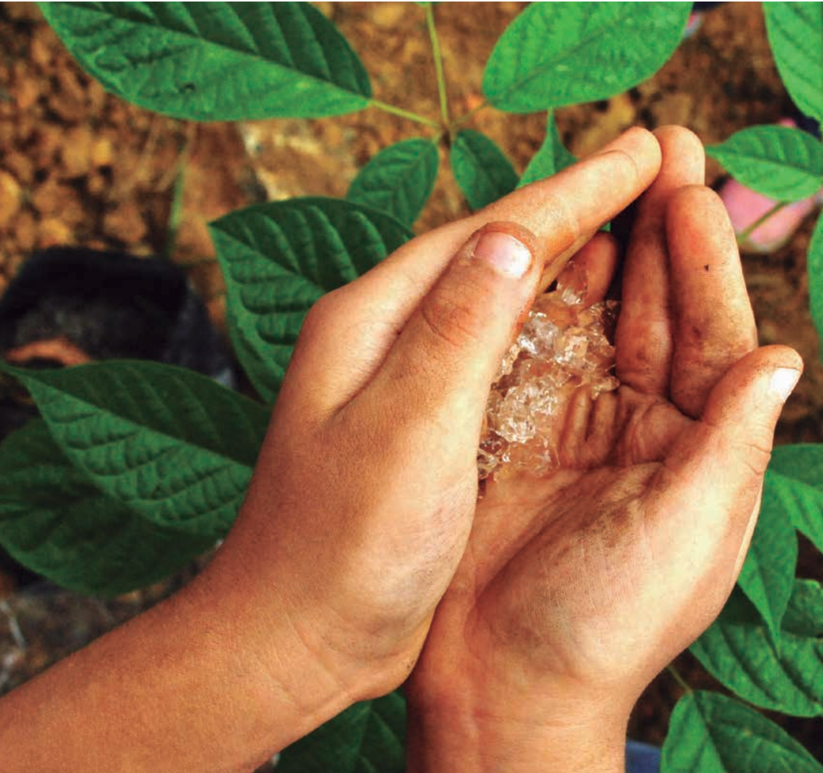
Foto 10. Siembra de árboles en vivero para reforestación