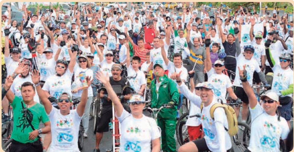
Foto 18. Reunión por el derecho a las ciclovías, Cali