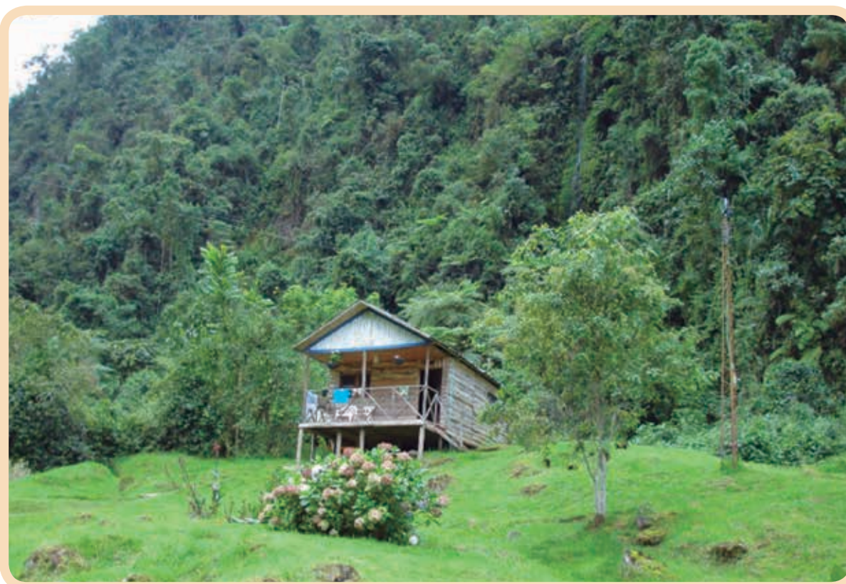
Foto 26. Casa saludable, municipio de Sevilla, Valle