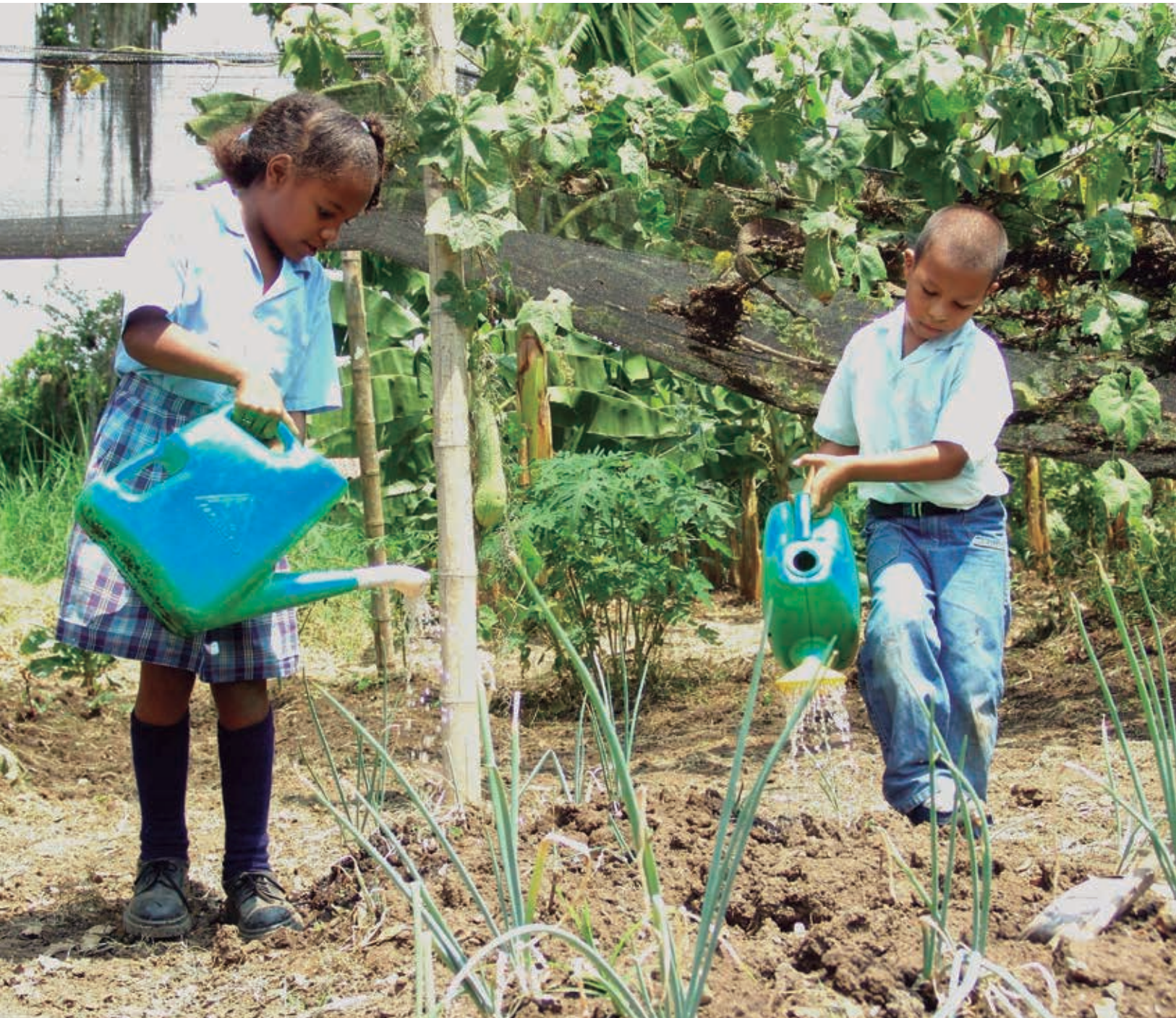
Foto 21. Huerta de los niños Fundación Hormiguero