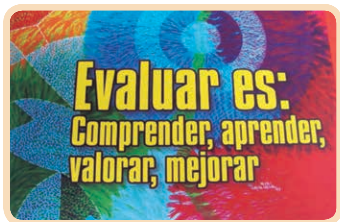
La evaluación en educación

mismos, en una interacción constante con diversos grupos sociales, de los cuales debe partir la construcción de estos con la intervención total de los actores para garantizar la estructuración y aportes de estrategias que conduzcan a un sistema educativo de gestión ambiental óptimo y desarrollo sostenible de la región o zona en estudio. En este sentido la educación constituye un espacio donde la dimensión ambiental puede dar un nuevo sentido a los procesos de formación del sujeto, a través de la transformación de las mismas concepciones y prácticas educativas (CVC, 2013).