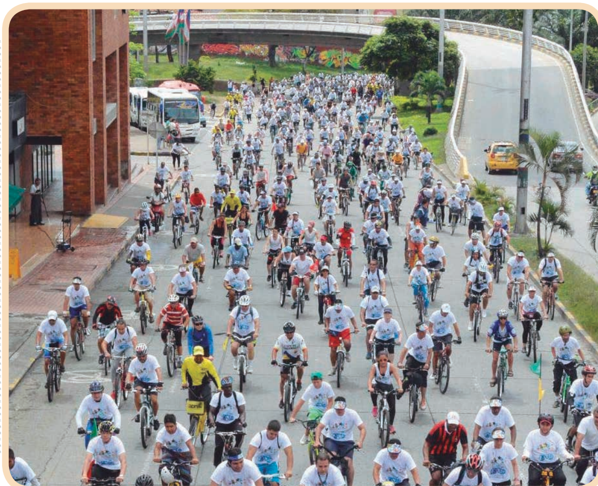
Foto 30. Reunión por el derecho a las ciclovías, Cali