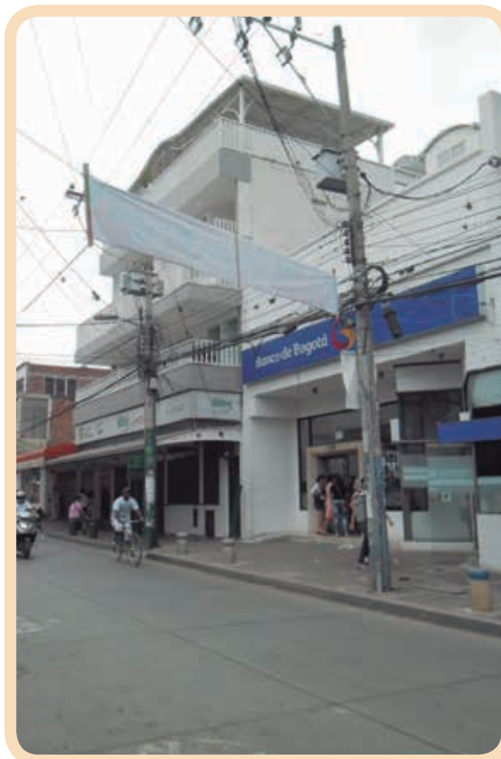
Foto 34. Zona comercial Yumbo, Valle del Cauca