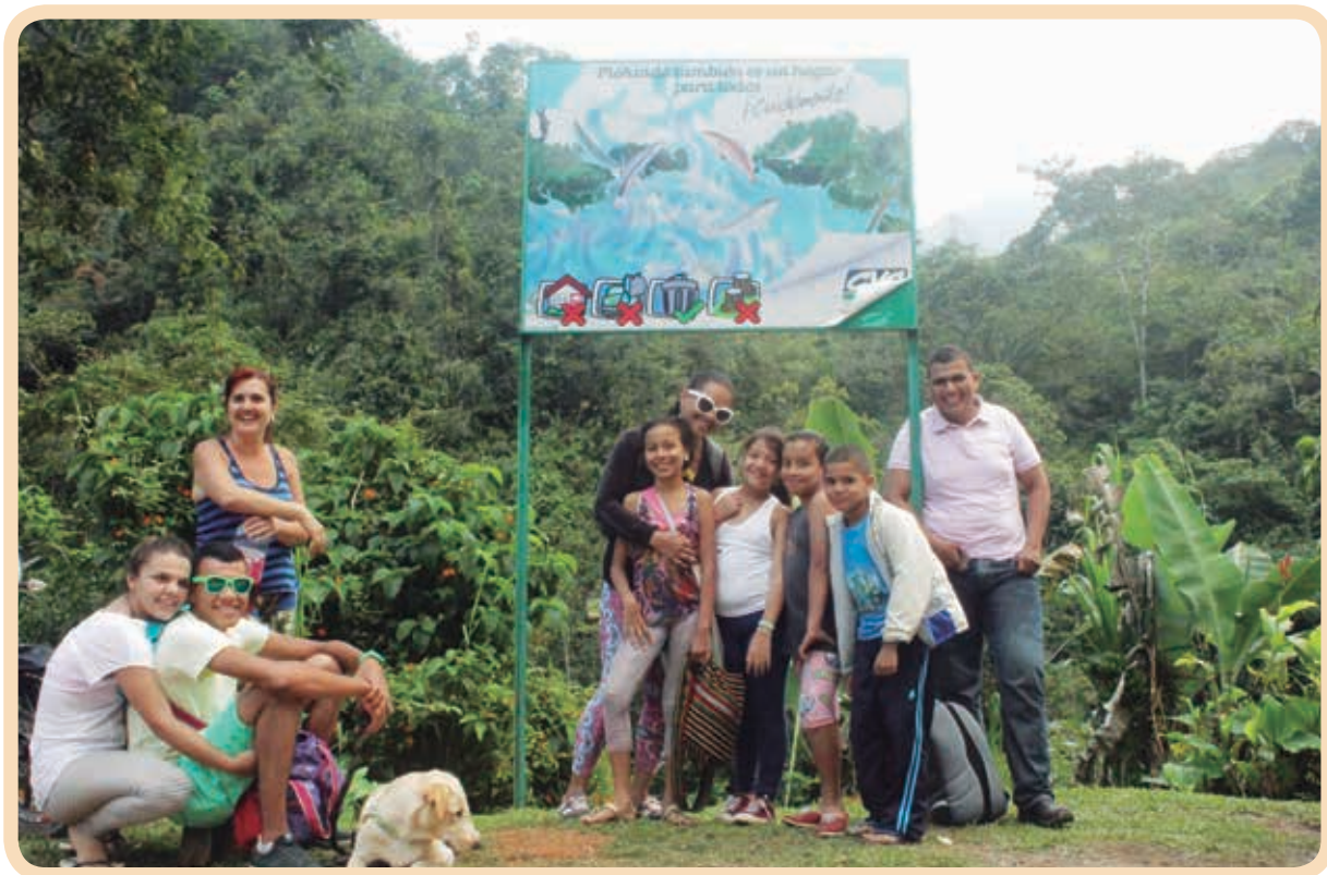
Foto 31. Turismo ecológico, río Pichindé

Metodología. Escoger destinos turísticos cercanos a la institución educativa e investigar sobre el manejo que la entidad o la compañía le da a esta zona en cuestión de sostenibilidad o protección ambiental. Tener en cuenta las siguientes consideraciones: el transporte hacia el sitio y su regreso, el lugar de estancia y su relación con el entorno (hoteles, restaurantes y atracciones certificadas ambientalmente), el comportamiento que usted tendría frente al medio ambiente y la cultura presente en el destino turístico.