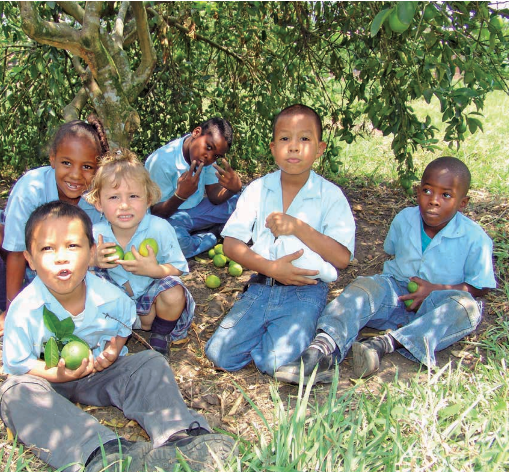
Foto 1. Cosecha de frutos, niños de la Fundación Hormiguero