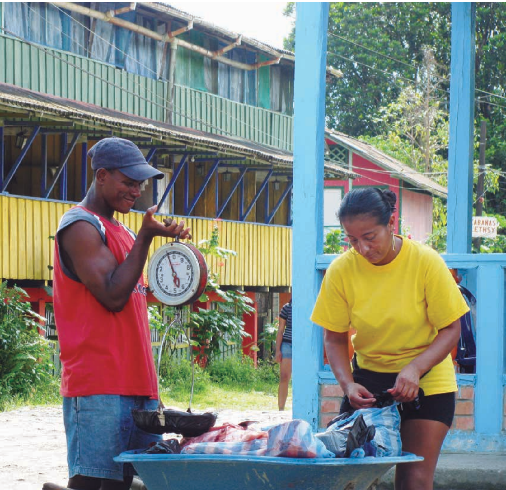
Foto 6. Venta ambulante de pescado, Juanchaco, costa pacífica