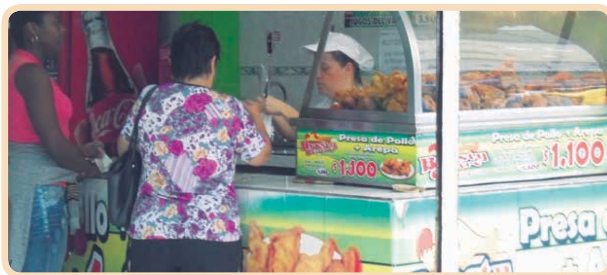
Foto 4. Comercio de Cali