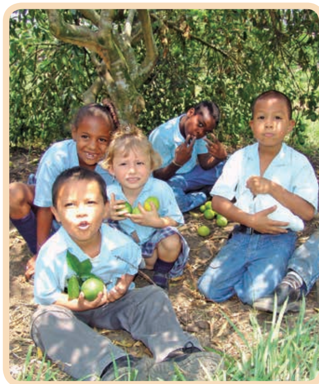
Foto 13. Cosecha de frutos, niños de la Fundación Hormiguero