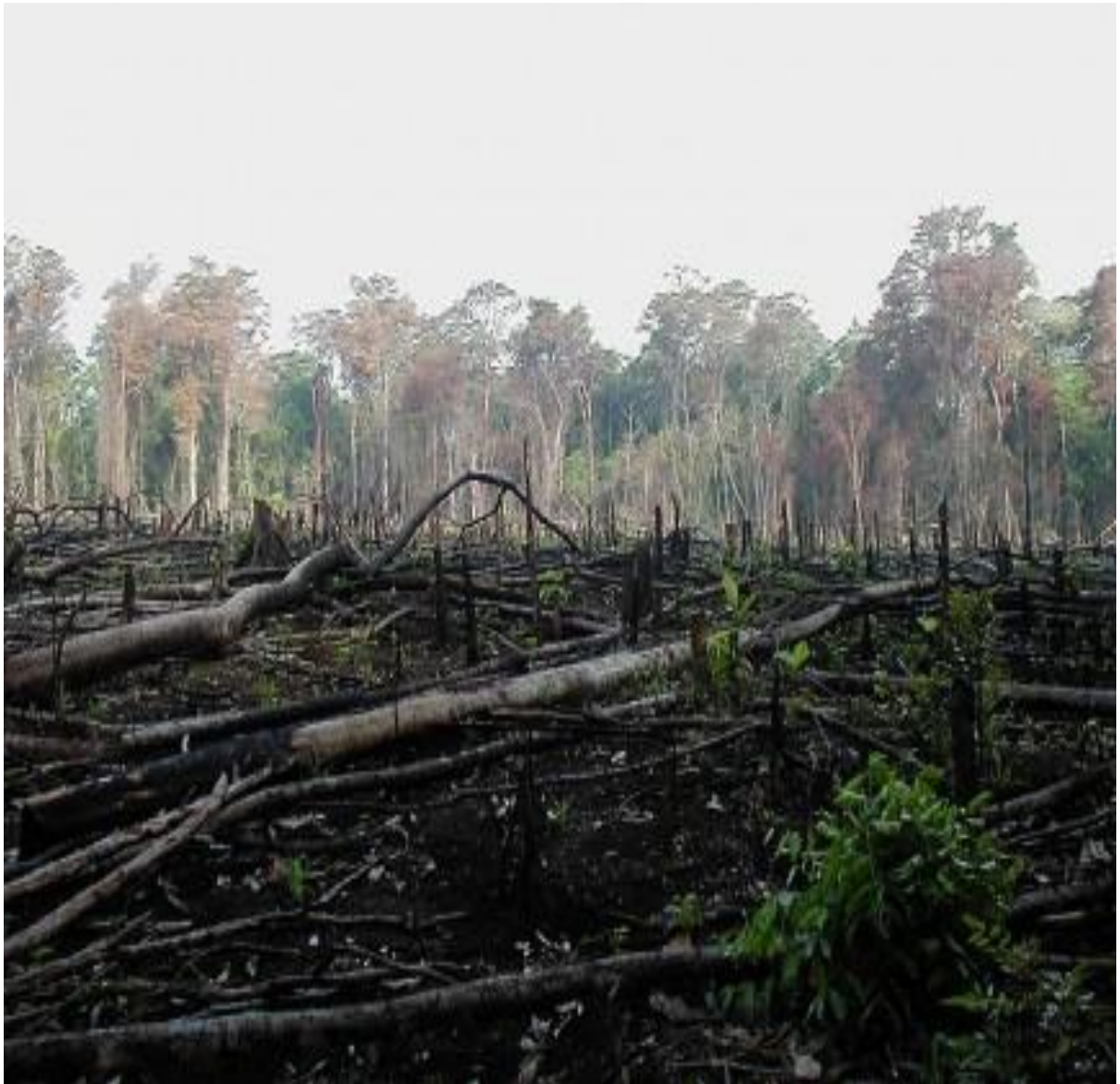
Imágenes - Google