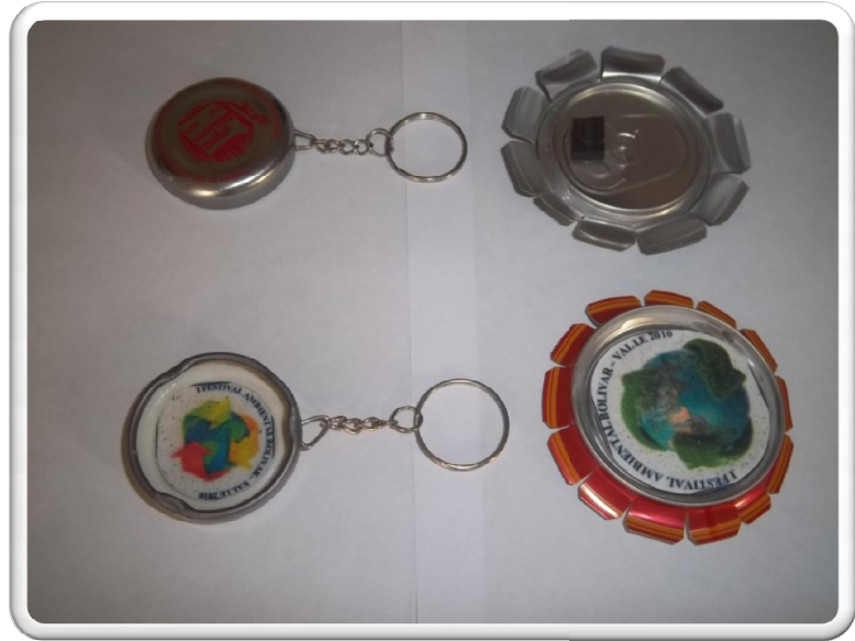
Boligrafos y llaveros