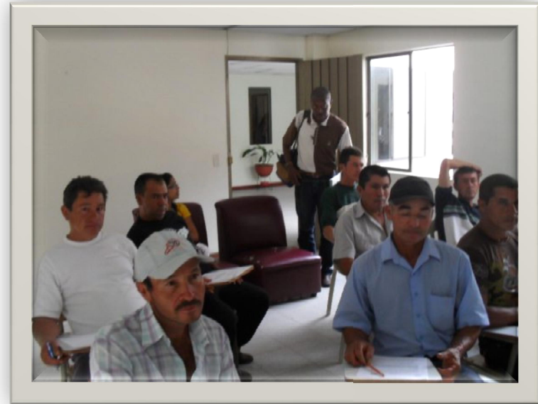
Talleres de Educación y Sensibilización Ambiental