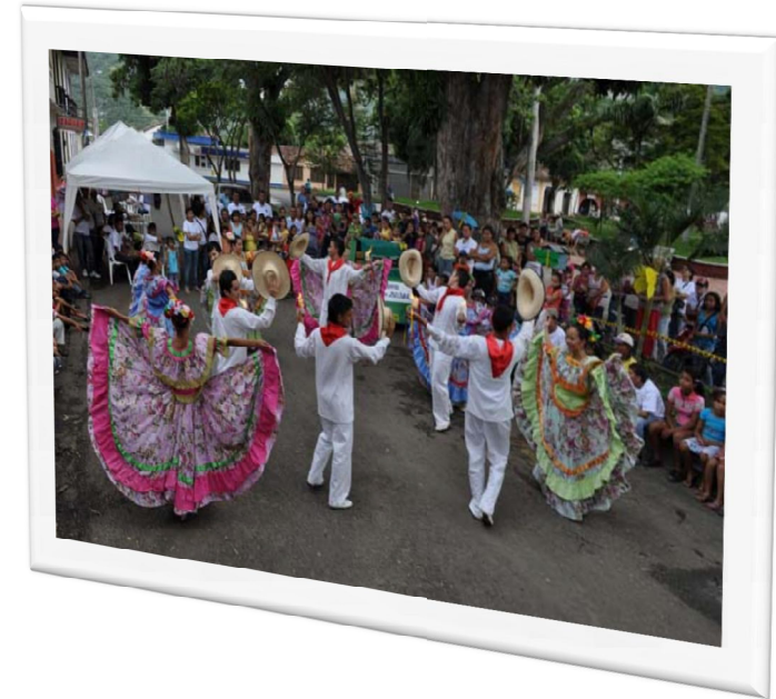
Comparsas y festival como campañas de Educación y Sensibilización Ambiental