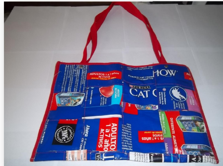
Imanes para Neveras y trabajos de reciclaje con productos utilizados