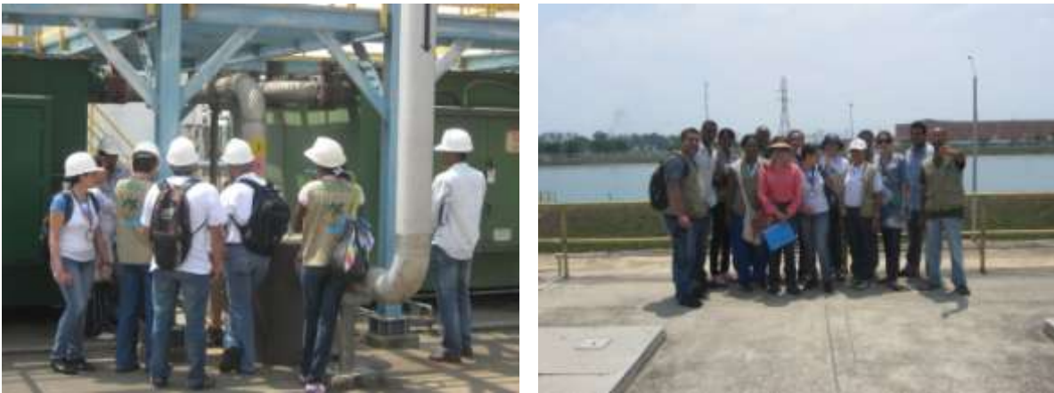
Recorrido por la PTAR y Planta de Puerto Mallarino (Reservorio)

De igual forma, EMCALI puso a disposición espacios como las plantas de tratamiento de agua potable y de aguas residuales para el conocimiento de los procesos. Se considera que estos elementos son esenciales y ayudan y facilitan la sensibilización frente al tema del agua en la ciudad. Esta empresa, facilitó una gira a conocer la experiencia de la Planta de Tratamiento de Agua Residuales - PTAR y la Planta de Tratamiento de Agua Potable de Puerto Mallarino. Esta actividad se realizó el 18 de febrero de 2010 y a ella asistieron delegados de EMCALI, tres personas delegadas de la CVC, un representante de la interventoría y el equipo técnico de la Fundación ECOBIOS.