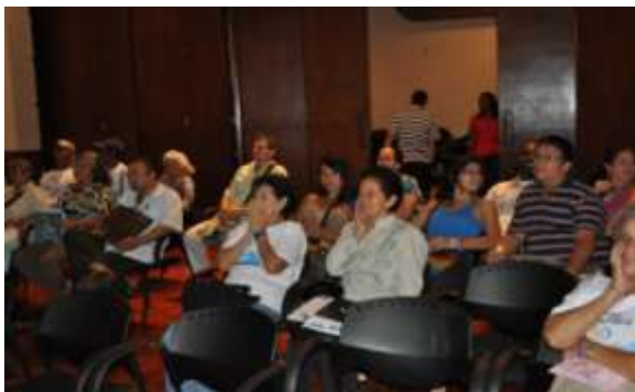
Capacitación auditorio CVC