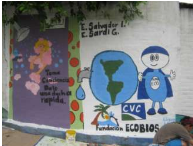
Mural comuna 3