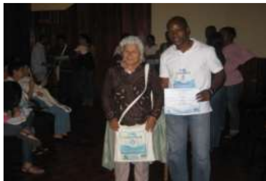
Entrega de kit educativo a facilitadores