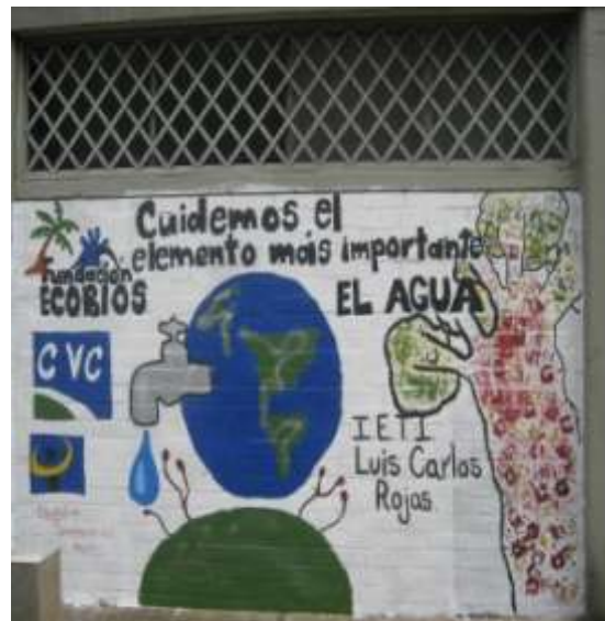
Mural comuna 17