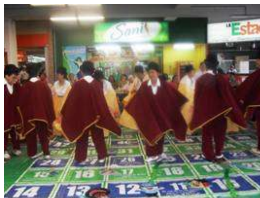
Participación grupo Las Orquídeas (Adulto mayor)