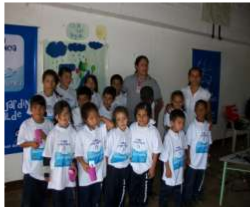
Guardianes del agua I.E Holguin Sardi