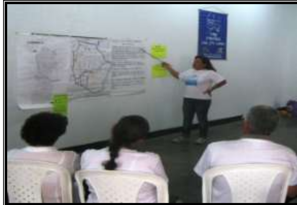
Socialización mapa comuna 17