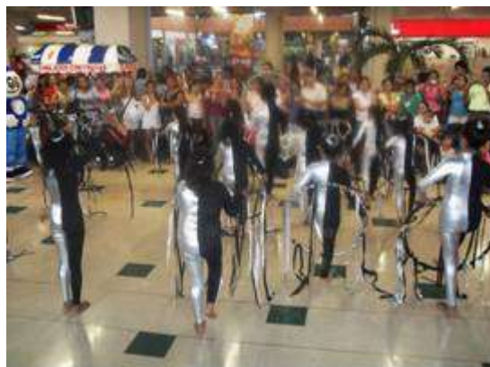
Participación grupo de danzas Liceo Juventudes