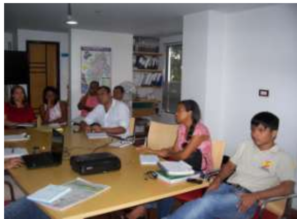
Reunión 9 de febrero, con participación de CVC, ECOBIOS, EMCALI Y FUNDAVIDA (Interventoría)

De otro lado, EMCALI mostro interés en apoyar la implementación del proyecto. En reunión realizada el 9 de febrero, facilitó información sobre los consumos, socializó sobre los programas que está realizando en las