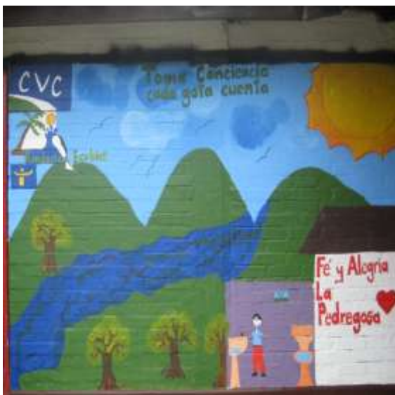
Murales Comuna 18