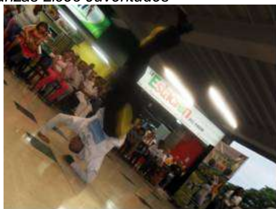
Jóvenes bailando break dance