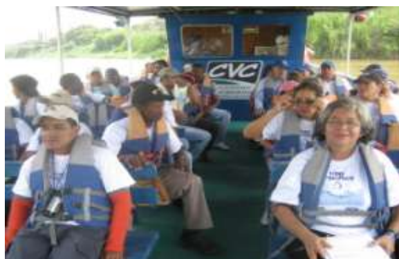
Recorrido Barco Escuela con Comité de Apoyo

Por otra parte se lograron editar las imágenes que se tienen sobre las potencialidades en recursos hídricos en las comunas 18 y 20 y las experiencias sobre uso eficiente del agua en las viviendas, esta información se encuentra e las memorias que hacen parte del kit de herramientas entregados a los facilitadores.