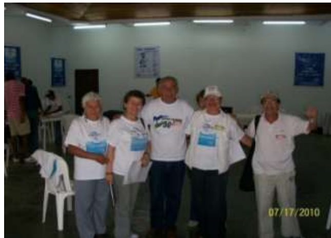
Representantes de varias comunas en la jornada de trabajo