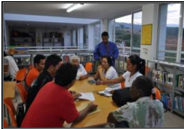
Jornada de preparación de evento en la comuna 18

De las evaluaciones de las jornadas por parte de los asistentes al taller se destaca: