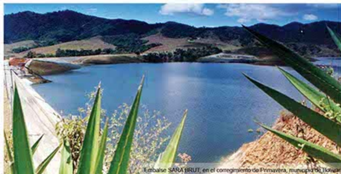
Embalse SARA BRUT, en el corregimiento de Primavera, municipio de Bolívar.