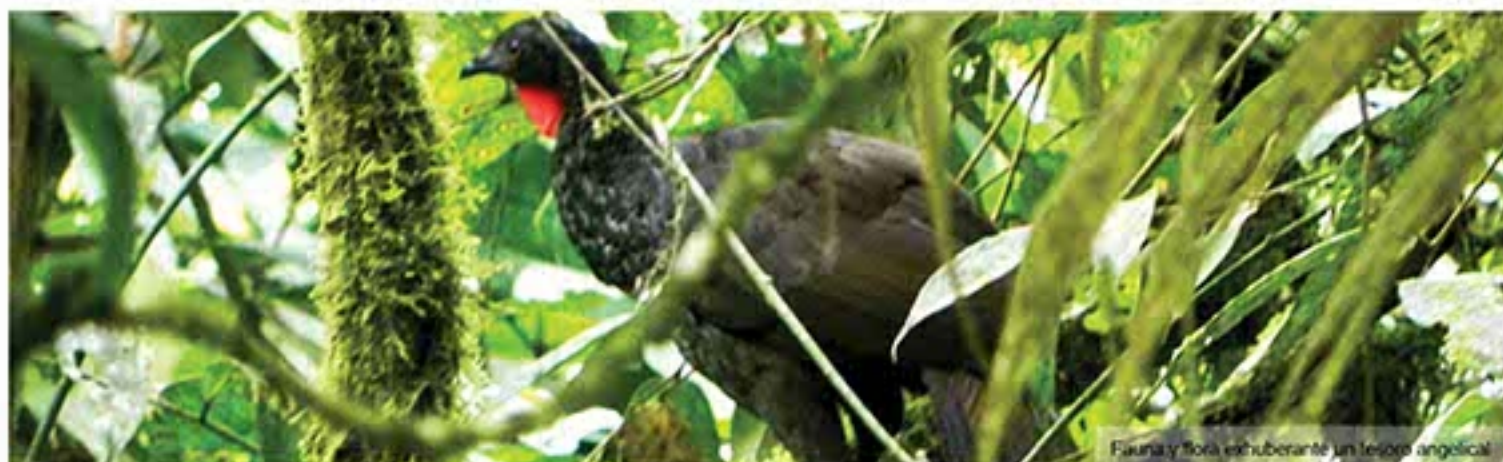
Fauna y flora exuberante en un tesoro angelical

La campaña de la CVC para la conservación de la subcuenca Los Ángeles en el Norte del Valle fue seleccionada por la ONG Internacional RARE Conservation dentro de su programa Pride , lo que permitirá financiar su ejecución durante los próximos dos años.