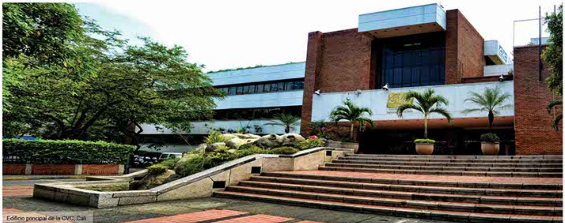
Edificio principal de la CVC, Cali

El Consejo Directivo de la Corporación definió el cronograma de elección del Director General en propiedad quien desempeñará el cargo hasta el 31 de diciembre de 2015. El 24 de julio se realizará la designación del mismo.