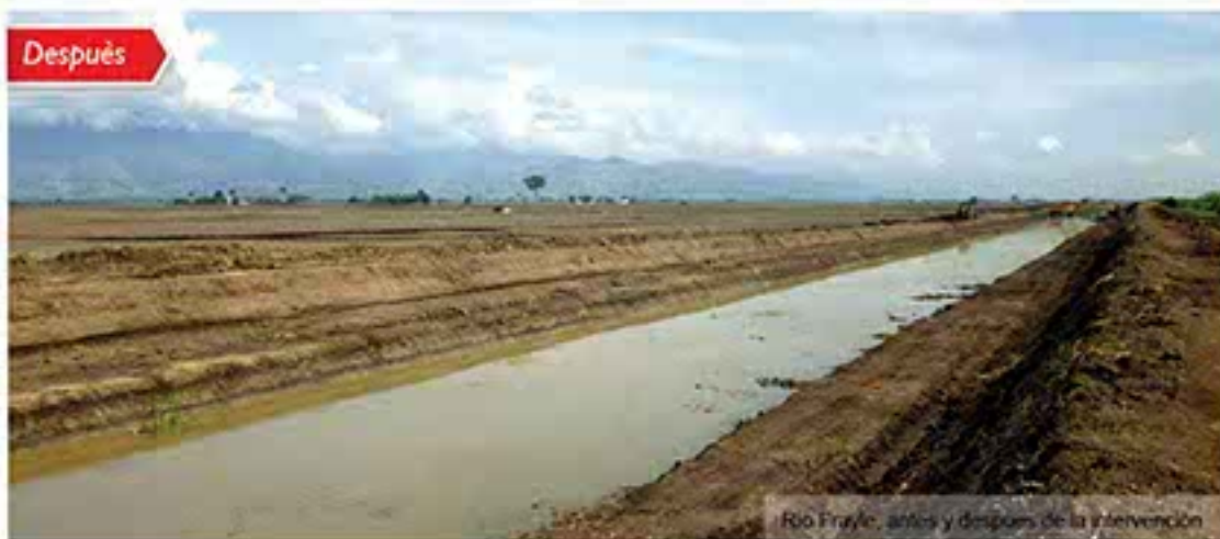
Río Frayle, antes y después de la intervención

tervenciones para la recuperación de la capacidad hidráulica de 9 cauces en diferentes sectores del departamento del Valle, el convenio fue suscrito con el Ministerio de Ambiente y Desarrollo Sostenible por un monto de $15.709.974.000