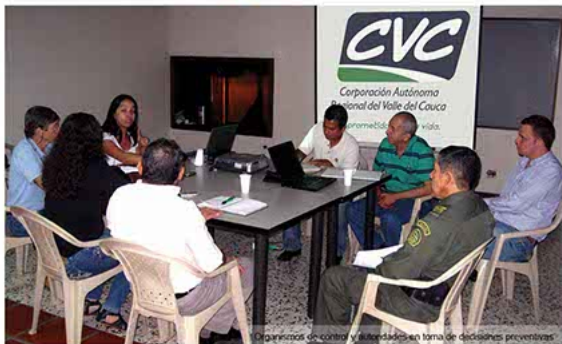
Organismos de control y autoridades en toma de decisiones preventivas

17 municipios considerados en máxima y alta prioridad de protección. La Comisión Asesora Departamental para la Prevención, Mitigación y Control de Incendios Forestales del Valle del Cauca, recomienda a la ciudadanía abstenerse de realizar actividades que impliquen el manejo de fuego.