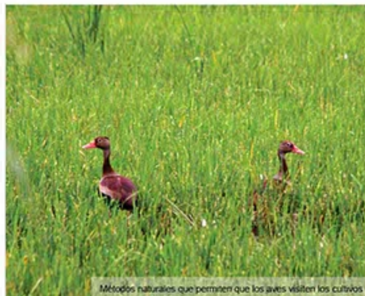
Métodos naturales que permiten que las aves visiten los cultivos

El resultado es un arroz más saludable, de mejor sabor