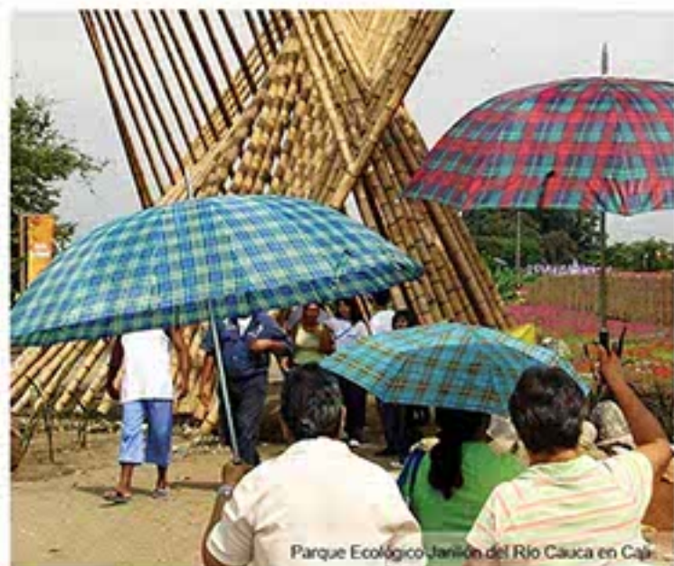
Parque Ecológico Jardín del Río Cauca en Cali.

Según datos de la Red Hidroclimológica de la CVC, el caudal del río Cauca Termino con un 38% por debajo de su nivel histórico en el mes de junio.