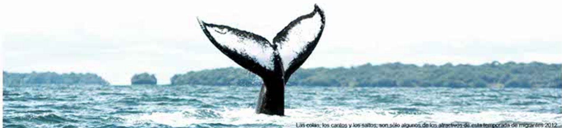
Las colas, los cantos y los saltos, son sólo algunos de los atractivos de esta temporada de migrantes 2012.

el 2012 y cuenta con el respaldo de Parques Nacionales Naturales, la Dimar, los Consejos Comunitarios, los habitantes de la región, la Alcaldía del Puerto y por supuesto la CVC.