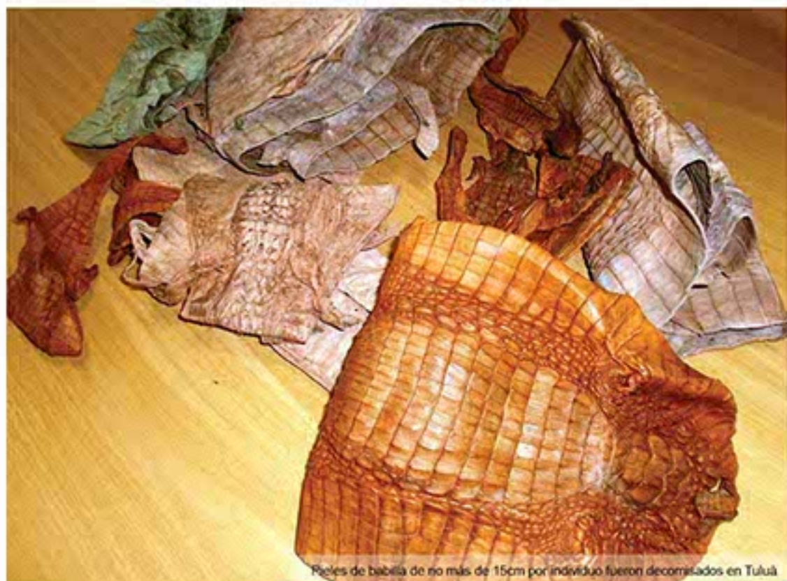
Pieles de babilla de no más de 15cm por individuo fueron decomisados en Tuluá