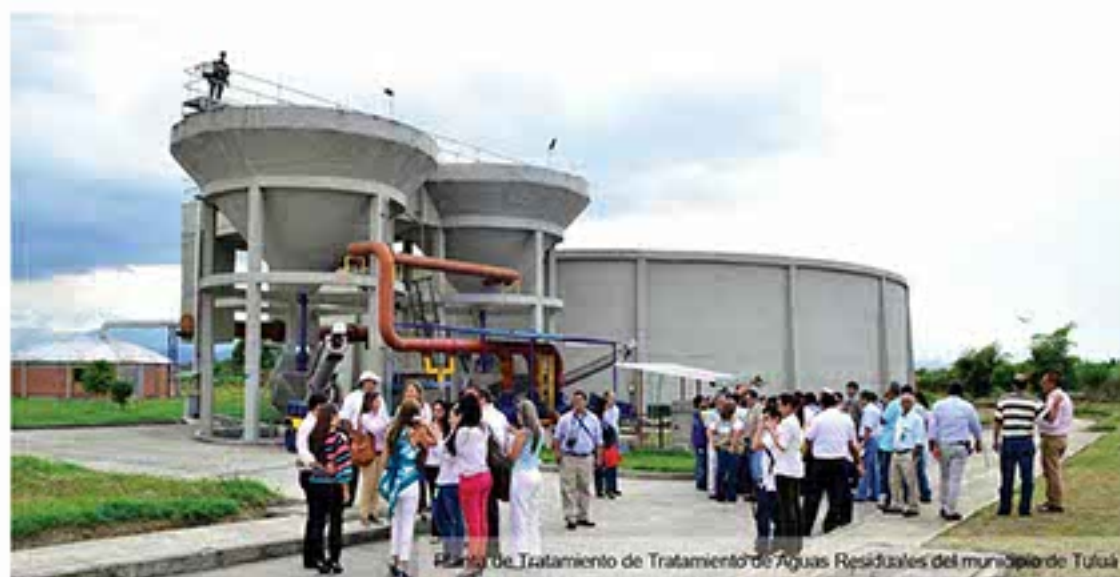
Planta de Tratamiento de Aguas Residuales del municipio de Tuluá

Con una inversión de 10 mil millones de pesos, el Ministerio de Vivienda, Ciudad y Territorio, la Alcaldía de Tuluá y la CVC, se logrará tratar el 100% de las aguas domésticas e industriales provenientes del municipio de Tuluá, reduciendo la carga contaminante del río Cauca.