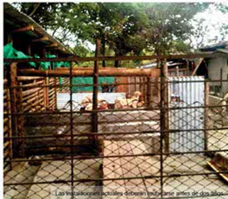
Las instalaciones actuales deberán reubicarse antes de dos años