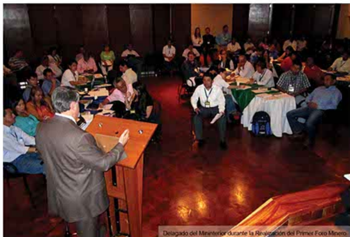
Delegado del Ministerio durante la Realización del Primer Foro Minero.

"Desde que se detectó la situación en 2009 la CVC ha realizado todas las visitas técnicas para definir los daños ambientales en los sectores de Bencidones, Zaragoza, La Laguna, emitiendo los correspondientes