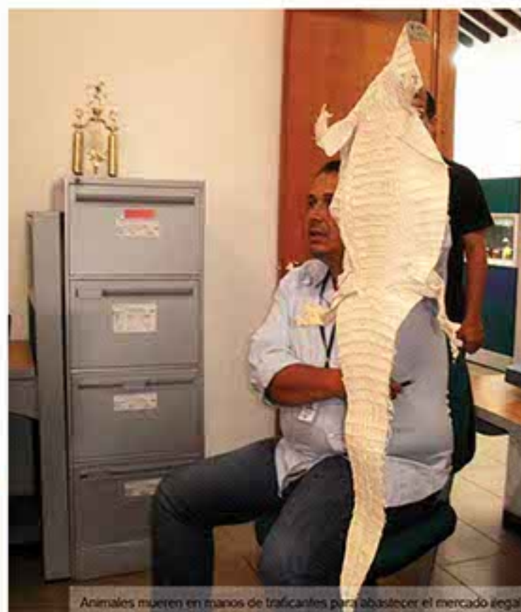
Animales muertos en manos de traficantes para abastecer el mercado ilegal