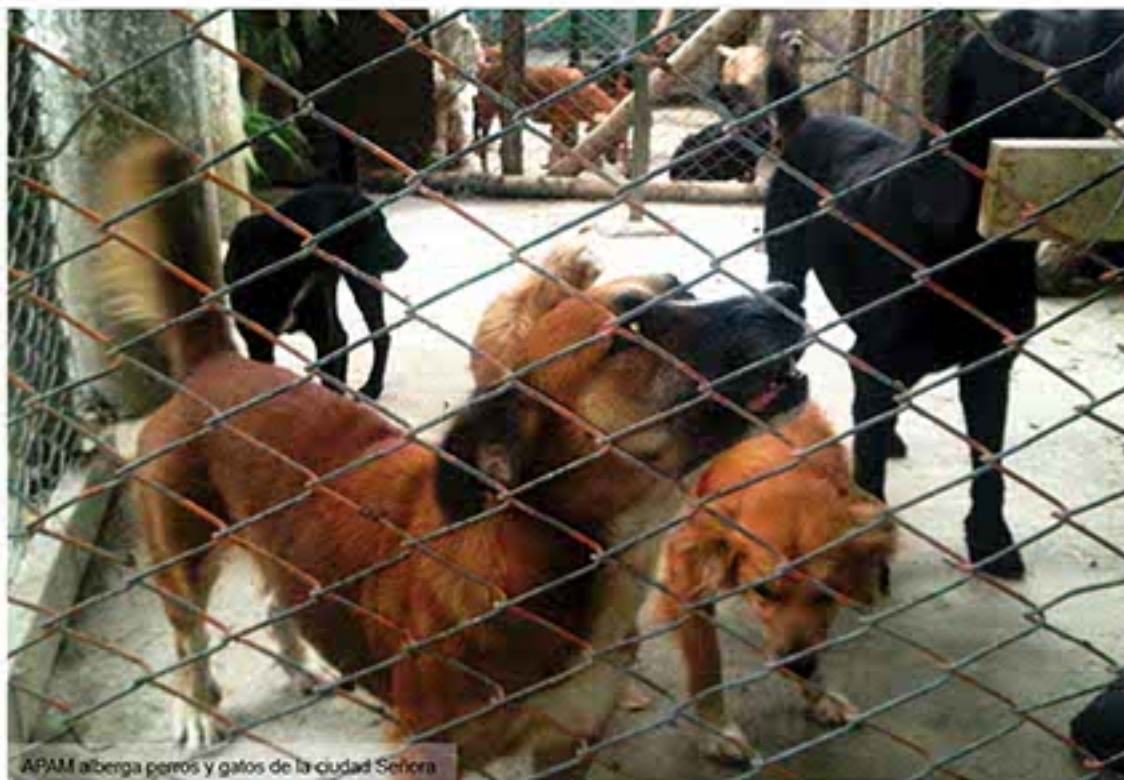
APAM alberga perros y gatos de la ciudad Señora

Por Idaly Herrera Brítez Comunicaciones CVC