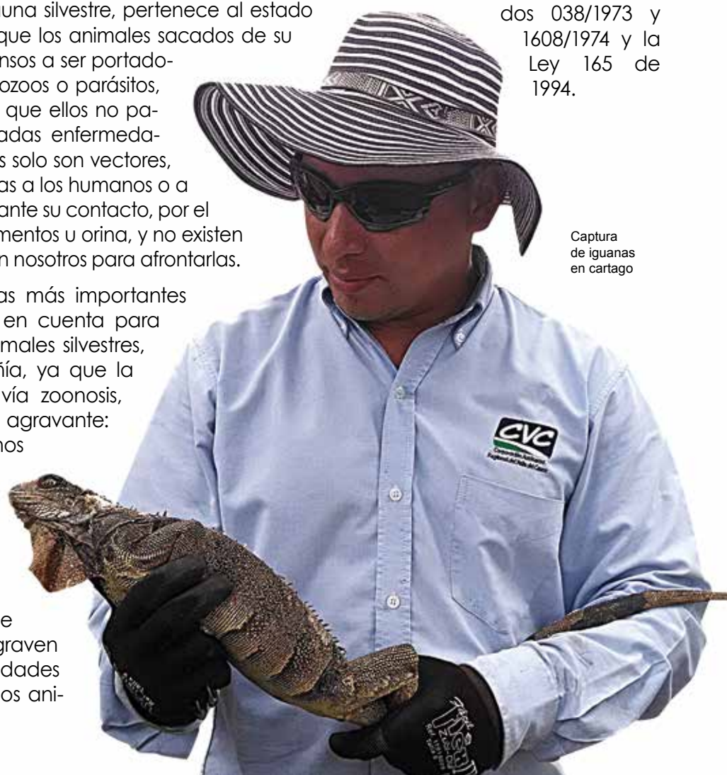
Captura de iguanas en cartago

Además, la captura, transporte, almacenamiento, comercialización o cualquier forma de explotación de especies de la fauna y la flora silvestre, o cualquiera de sus partes, es un delito que está penalizado por la legislación ambiental colombiana: Ley Seguridad Ciudadana. 1453 de 2011, Decreto 1608/1978; los acuerdos 038/1973 y 1608/1974 y la Ley 165 de 1994.