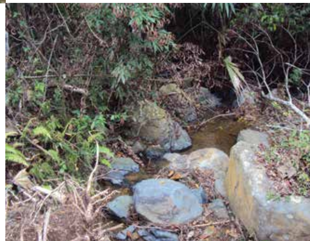
Cuenca de Río Piedras en Ríofrío

La Corporación Autónoma Regional del Valle del Cauca, seguirá desarrollando proyectos en pro de la protección y conservación de los recursos naturales y el ambiente, y qué mejor que cofinanciando a entidades sin ánimo de lucro a través del Fondo Participativo para la Acción Ambiental que buscan el desarrollo sostenible de la región.