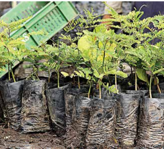
Plántulas para reforestación

La CVC a través de la Fundación río Ríofrío y Piedras, en el marco del proyecto del Fondo Participativo para la Acción Ambiental, buscan aumentar la cobertura vegetal de la cuenca en 25 hectáreas mediante sistemas silvopastoriles, utilizando franjas aisladas por cerca eléctrica, además de la estabilización de suelos a través de obras biomecánicas.