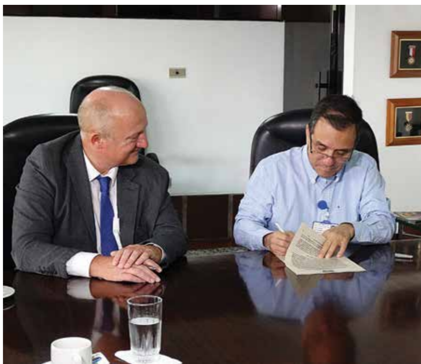
Firma del Convenio CVC y Países Bajos

Los convenios tienen que ver con la implementación de tecnología holandesa para la gestión de inundaciones en el corredor río Cauca, la revisión y optimización de la regla de operación del embalse de Salvajina y la planificación y gestión de las aguas subterráneas en el Valle del Cauca.