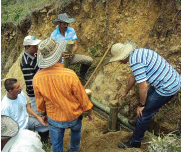
Recuperación de suelos

CVC Por Paola Andrea Holguín Comunicaciones CVC